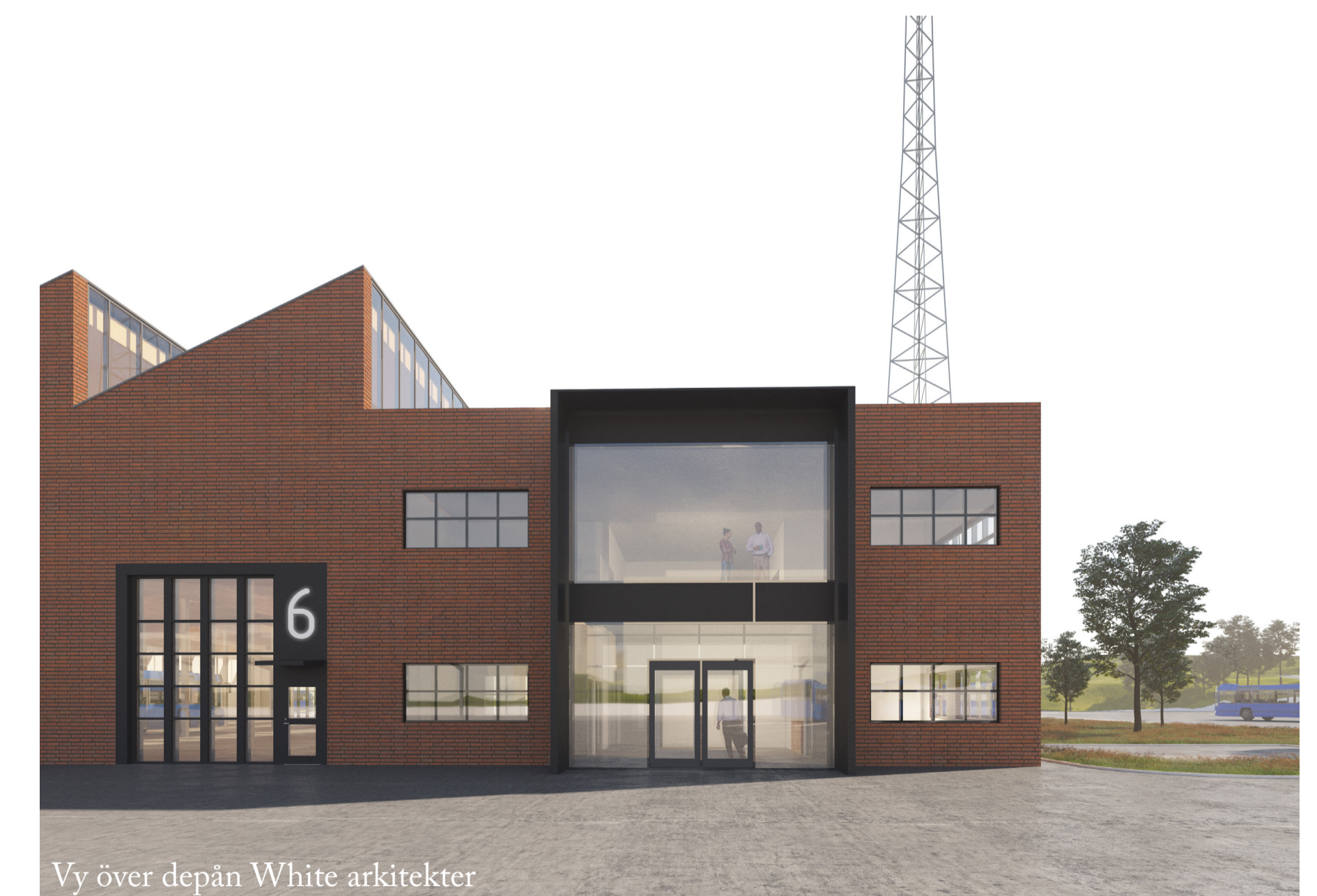
Vy över depån White arkitekter