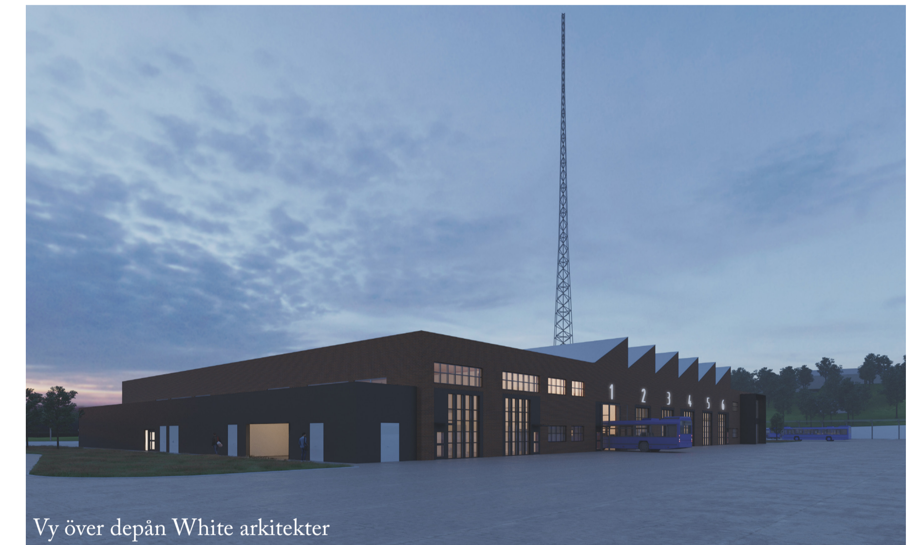
Vy över depån White arkitekter